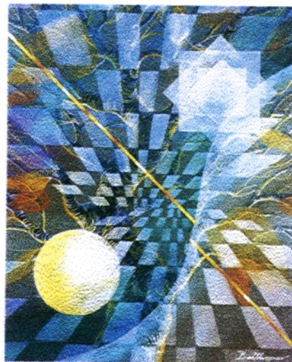
"Magic Slyding" 2000, 46 x 38 cm